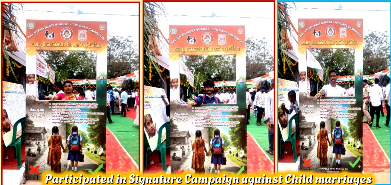
Participated in Signature Campaign against Child marriages