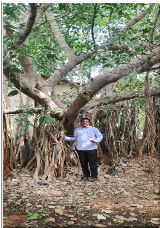
Banyan tree planted at Krishna Hostel, S K University in 1995

For the past 33 years he planted more than 10,000 trees in the places where I studied and worked.