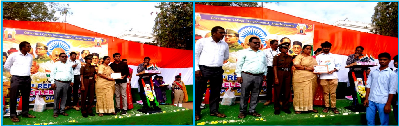
Certificate distribution to NSS Volunteers who have done Service during Satya Sai centenary celebrations at Puttaparthi