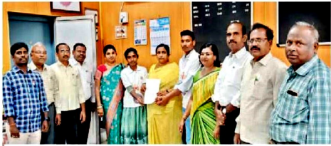
విద్యార్థిని అభినందిస్తున్న అధ్యాపకులు