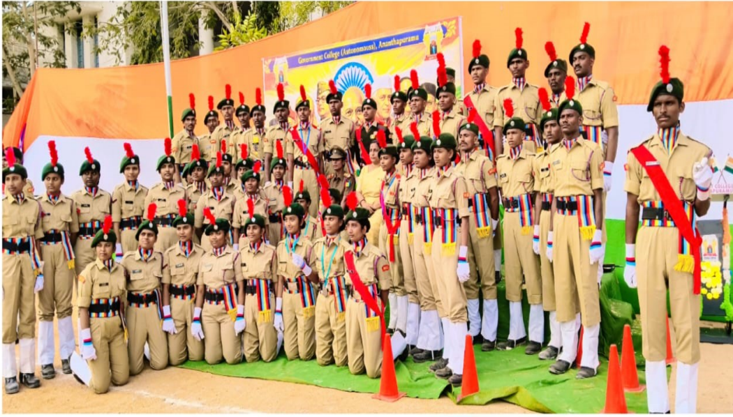
NCC Candidates on the eve of Republic Day