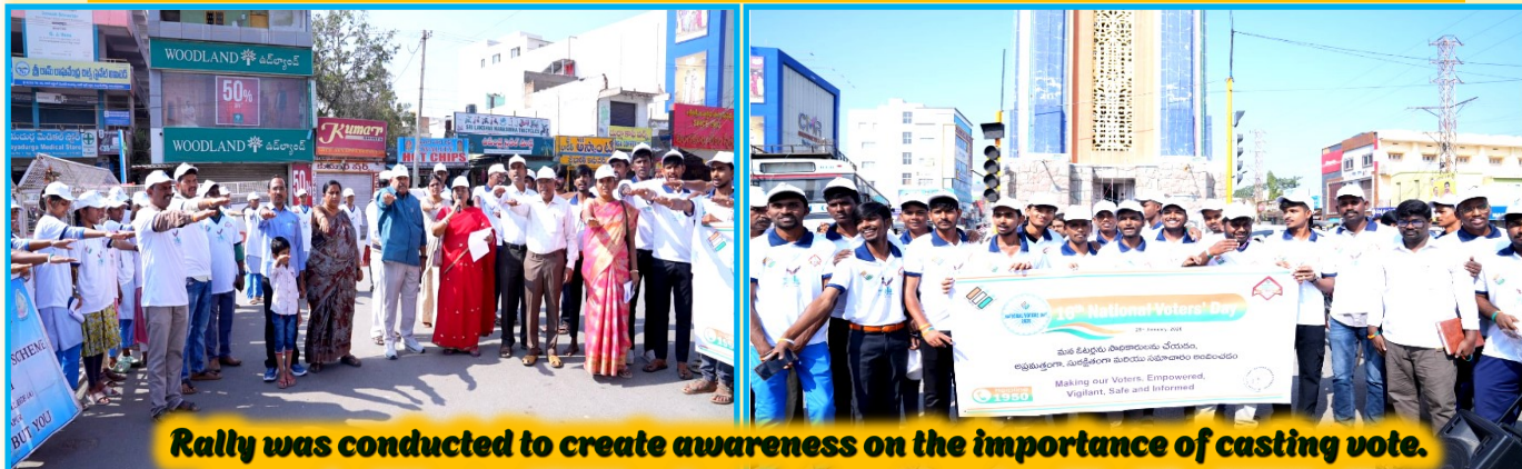
Rally was conducted to create awareness on the importance of casting vote.