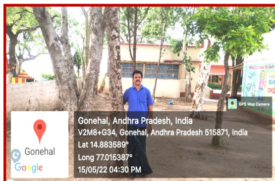
All these trees planted in M.P.U.P School, Gonehal, Bommanahal Mandal in 1997.