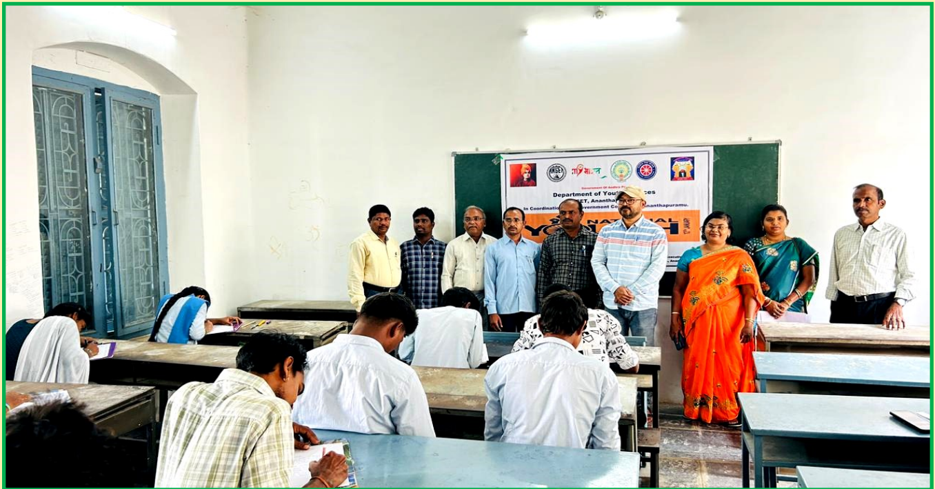
Essay writing competitions conducted on the eve of National youth day